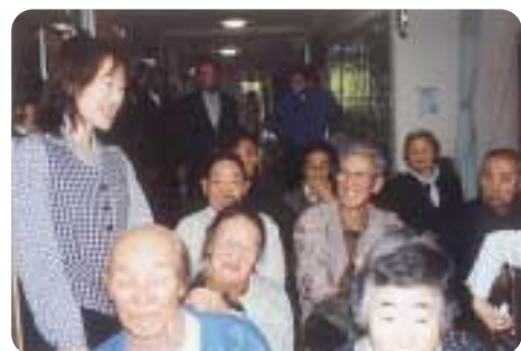
みんなそろって話の花が咲きます。