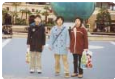
私を追いこしてしまいました。