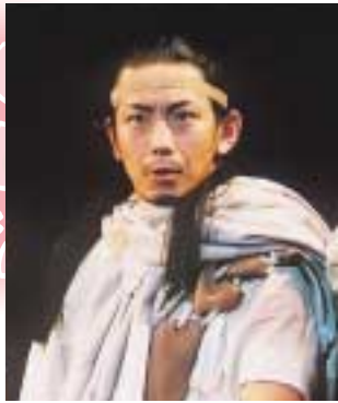
「アテルイ」ヒラテ役