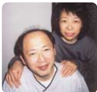
夫婦水いらずでゆっくりしてきました。

20周年記念となり久々の思い出話に花が咲きました。天気にも恵まれ絶好のドライブ日和でした。十和田湖周辺の景観のすばらしさを満喫し、湯瀬ホテルでは大きなゆったりとした部屋でつるぎ、風呂でのんびり汗を流し、食事大変美味しく、私共にとっては近年にないリフレッシュ旅行になりました。