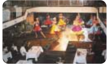
オペラハウス・ジョージタウンブリッジの踊りを見ながらディナークルーズ