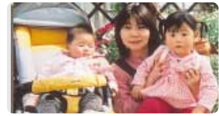
ホントはこうなのにイキとよくいわれています。

今回のようにソウエルクラブの制度を利用するにあたって、他にも様々なサービスメニューがあることを知り、改めて魅力的でいざというときに頼りになる存在として実感しました。