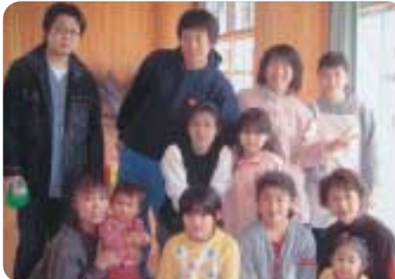
鹿角市児童センターで、職員と利用者の人と一緒に撮りました。ピースしているのが私です。