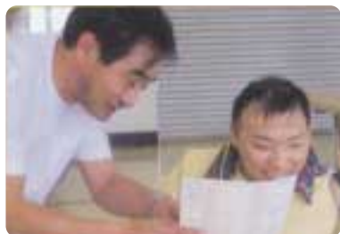
油断大敵。諸準備に注意を払いましょう。