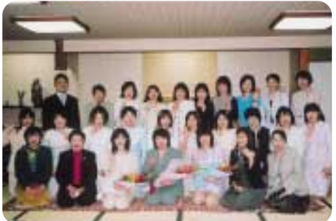
ソウエルでピース