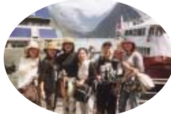
世界的にも有名なフィヨルド大自然をクルージング