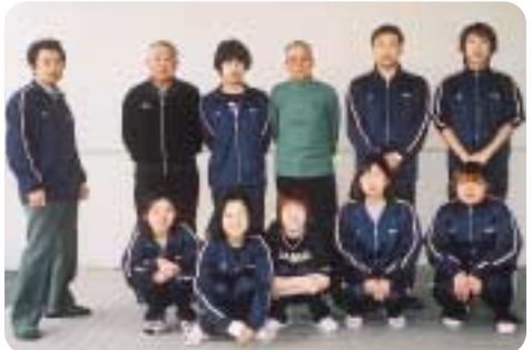
今年も、クラブ・サークル活動助成申請します