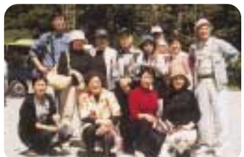
世界遺産ミルフォードサウンドにて

施設も街も自然に囲まれ、緑が豊富で、のびのびとした空間やゆったりと流れる時間は感動ものでした。百聞は一見に如かずですね。