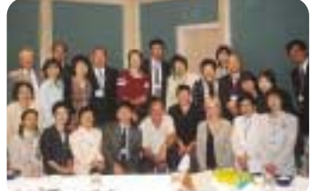
知的障害児と家族を支援する団体との交流にて