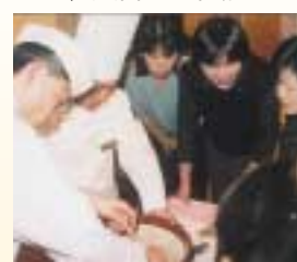
エクセルキクスイ じねんじょ(やまのいも)すり実演です。

今年度も中盤を過ぎ、元気と精一杯の気持ちを込めて、日々子ども達に接してくれる職員に「ありがとう」の思いと職員の食事研修を兼ねて"明星グルメツアー"を提案したところ、大喜びの参加となりました。