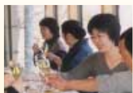
乾杯！楽しくゆっくり 味わいましょう

料理長からお料理の説明を受け一品一品味わいながら大変おいしくいただき大満足しました。その後、入浴し十和田湖を眺め景色のすばらしいことにまたまた大満足してきました。その感動は同じ鹿角に住んでいてもまたすばらしいものでした。早速自宅に戻り娘に報告し、今度はあなたと行こうねと！