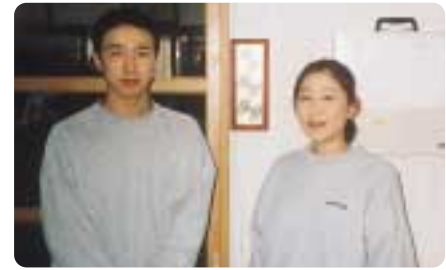
これからもがんばります

いです。この度、永年勤続の記念品として健康用品を頂きました。健康だからこそ、この仕事を続けられる事に喜びを感じ、子供達の若さに負けまいと心身共に若く、パワーアップ、バージョンアップしたいものです。