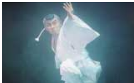
「春秋山伏記」大鷲坊役

舞台は生もの。毎回お客様の反応も違うし、自分の心に沸き立つものも違う。舞台にいる時の自分が一番好きだし、全身全霊かけられる仕事に出会えて幸せだと思う。自分自身の気持ちが高ぶるほど、舞台に血が騒ぐ。