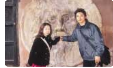
「ローマの休日」をしてきました(笑)