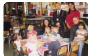
チャイルドケアセンターにて。先生と子供さんと一緒に。後列、右から二人目が筆者。