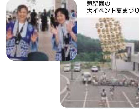
魁聖園の大イベント夏まつり