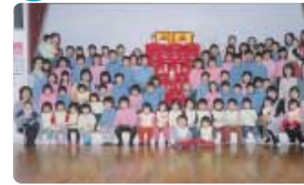
マリア園一同です