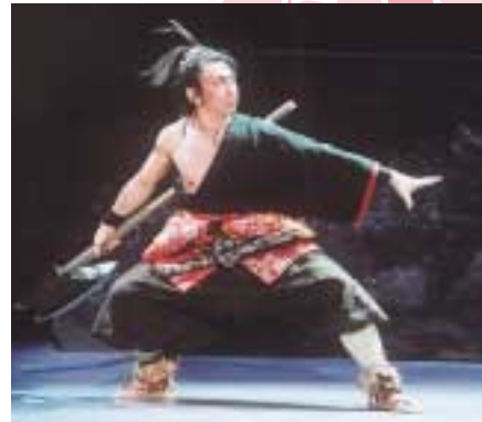
「男鹿の於仁丸」於仁丸役