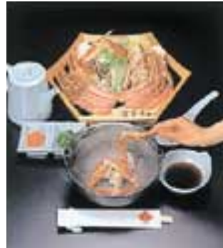
召しませ、かにしゃぶ

本物のかにの美味しさを北海道が生んだこの店で。各種コースの中からご予算に応じてお選び下さい。