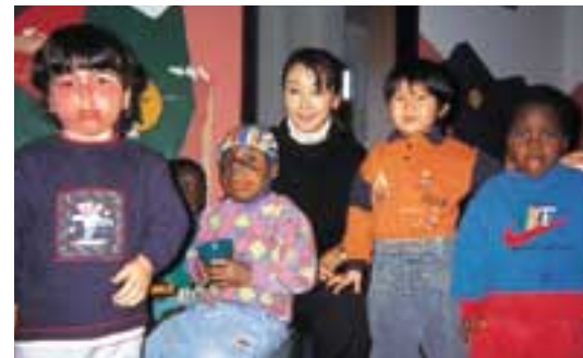
アンゴラの少年のレインボーカラーのヘルメットは頭蓋骨の代わり、痛々しい。

もっと小さいお子さんにも、ということで絵本を描きました。絵本は、家族や友達同士と一緒に読むことができますよね。何度も読み直せますし。この絵本が平和や戦争、生きることについて考えるきっかけになればと。