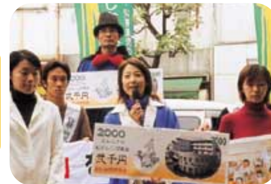
あしなが育英会の募金を呼びかけています。