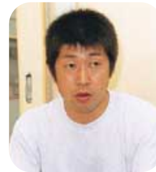
「また走りたい」と話す今さん。

自然が好き、人間が好きという今さんは、以前勤めていた会社では、陸上部に所属し、マラソンや駅伝に数多く出場した経験を持ちます。スポーツマンで独身、曲がったことは嫌いでお心の優しい好青年と施設長は評します。