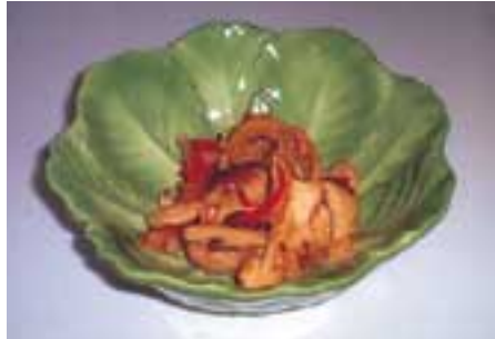
「焼き鶏のピリッと炒め」のできあがり。

比内地鶏を使ったキリタンポ汁が、一番美味ですが、ちょっと工夫した一品として、焼きおにぎりの上に鶏汁を豪快にかけて食べる「げんこつぶっかけ汁」や、大根おろし、人参おろしの上へ片栗粉を入れた鶏汁をかける、「もみじおろしの鶏あんかけ」なども、おいしい料理です。 注) 鶏汁とは、キリタンポ汁にキリタンポだけ入らない汁のこと。