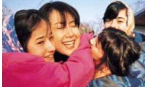
アフガニスタンの子どもたち、どうか生きていて。

すね。日本は今も戦後なのですから。生きることについて話し合えるように、愛、友情、依存、自立……そういったテーマも絵本に込めて描きました。今の子供たちが、すぐに分らなくても、大きくなって何かを始めるための糧にもらえるなら嬉しいですね。この絵本の売上金の一部も平和村への寄付になります。