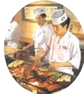
備長の炭火に炙られる、北の恵み。

本格派の炭焼処。海鮮焼き・野菜焼き・炭焼き魚などの他に、お寿司や刺身もおすすめです。