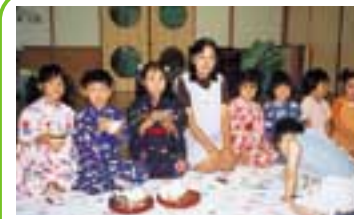
冷茶のお点前 (中央が私です)