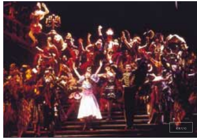
「オペラ座の怪人」の一場面

がら、これから続く舞台に胸をふくらませていました。ミュージカルの醍醐味を味わい、心身共にリフレッシュできた思い出に残る一日となりました。