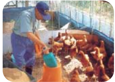
比内地鶏を飼育している道目木更生園

秋といえば、キリタンポ！キリタンポといえは比内地鶏！当施設で飼育されている比内地鶏を使い、少し変わった「焼き鶏のピリッと炒め」を紹介します。少し辛くて、歯ごたえがあって、食欲をそそる一品です。