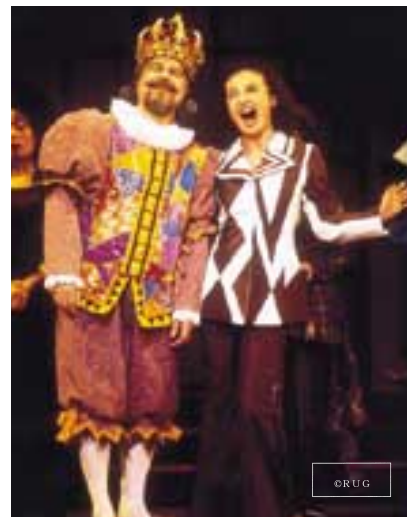
「はだかの王様」の一場面

うと思う。最後に王様がみんなに言われ、やっとまちがいに気づいて、国民のためのりっぱな王様になったと思う。