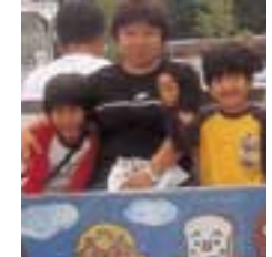
子供たちと一緒に。

4月から異動もあり、仕事に慣れることばかりに頭がいき、生活に余裕がありませんでした。夕方、子供を学校へ迎えに行き一緒に歩いて帰ると「あっ、つくし」「かまきりの卵」などハシャグ我が子。目線が違うとすばらしい発見があるもの。我が子が宝に見えた一日でした。